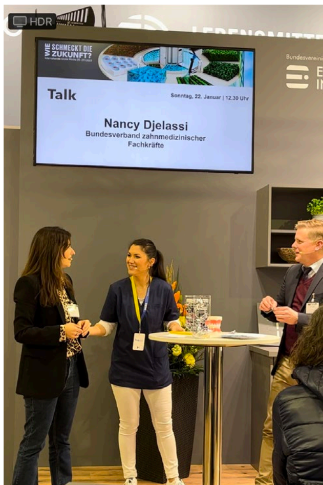
Abb. 2 ... einen nachhaltigen Beitrag zum Thema Zahn- und Mundgesundheit.